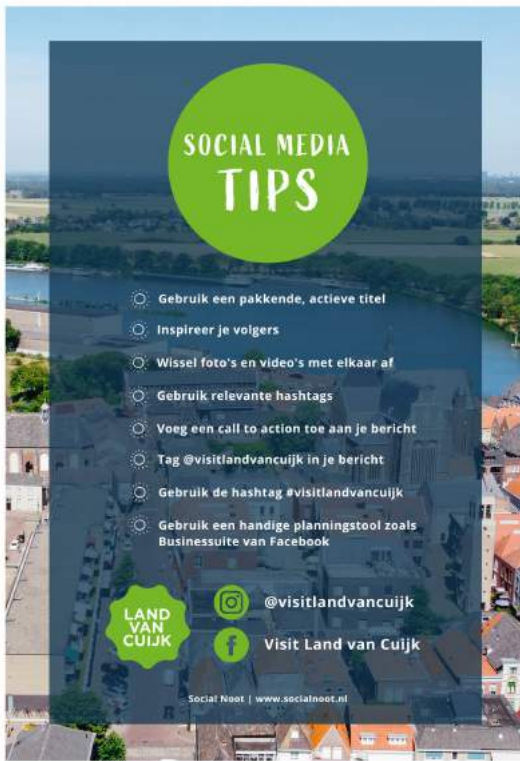
advies van Social Noot