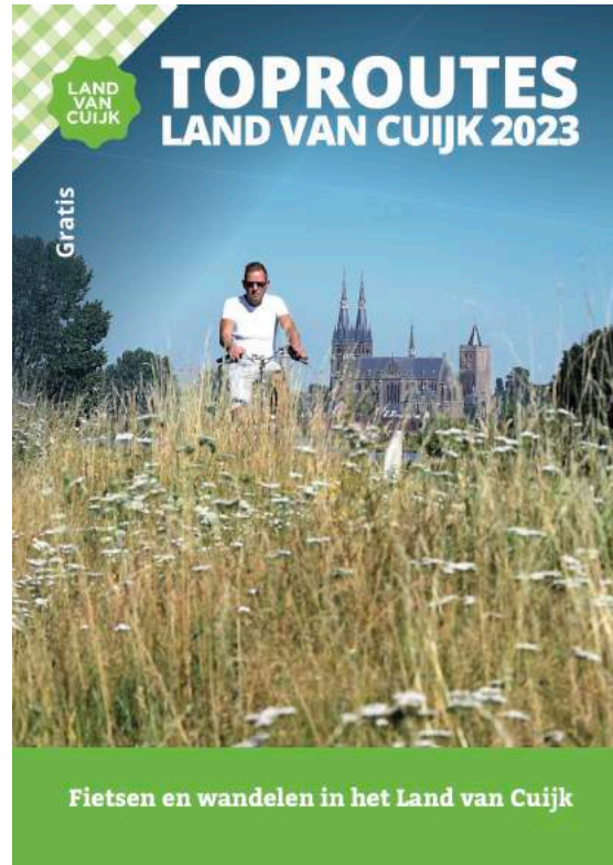
Fiets & Wandelboekje